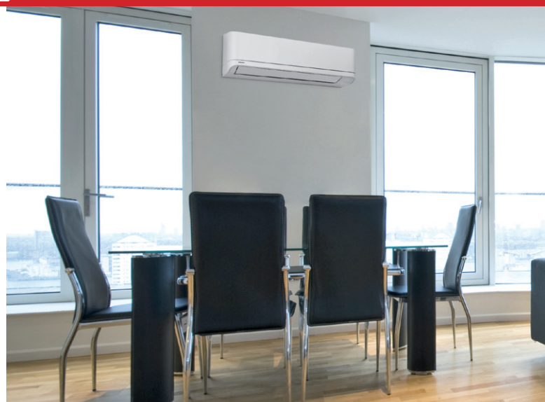
F-Gas quotas d'importation

Toshiba Airconditioning s'est voulu pédagogue, informatif, même formateur auprès d'une profession anxieuse face à ce changement de pratiques et rassurant sur l'utilisation et la manipulation de ce fluide, qui soulève bien des questions.