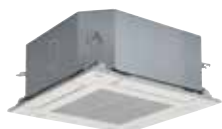
Cassette ultra-compacte 600 x 600