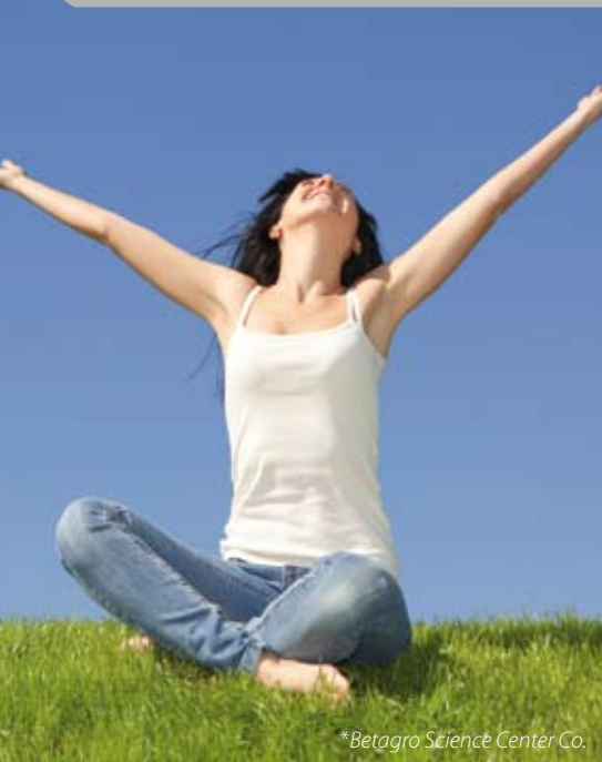
*Betagro Science Center Co.