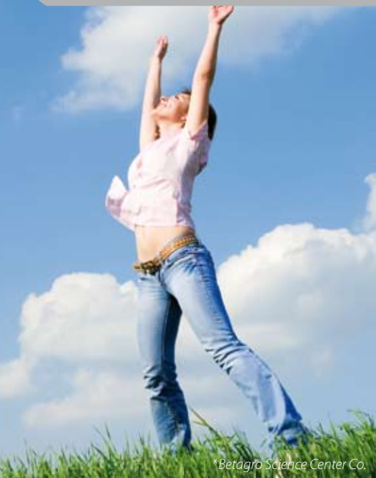
*Betagro Science Center Co.